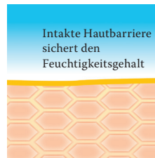
Intakte, schützende Hautbarriere mit Linolsäure-reichen Lipiden.

Um diesen Barrierestörungen sowie Fett- und Feuchtigkeitsdefiziten trockener